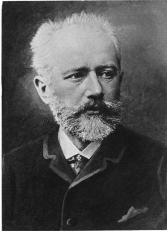
Piotr Ilich Tchaikovsky (1840-1893)