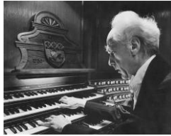
Jean Guillou (Angers, 18 de abril de 1930-París, 26 de enero de 2019)