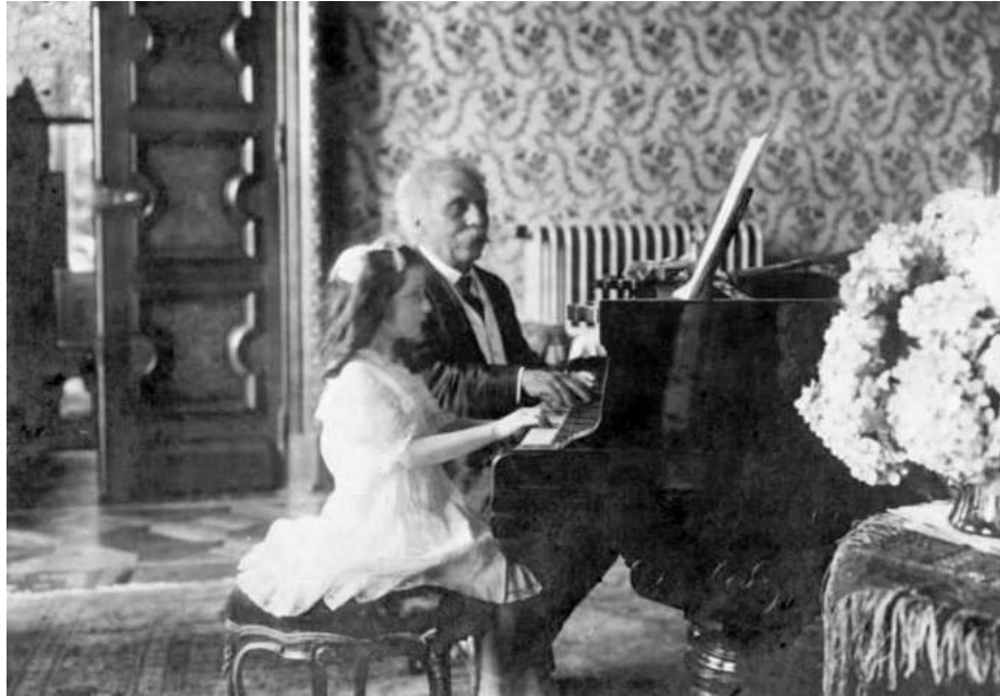
Gabriel Fauré (1845-1924)